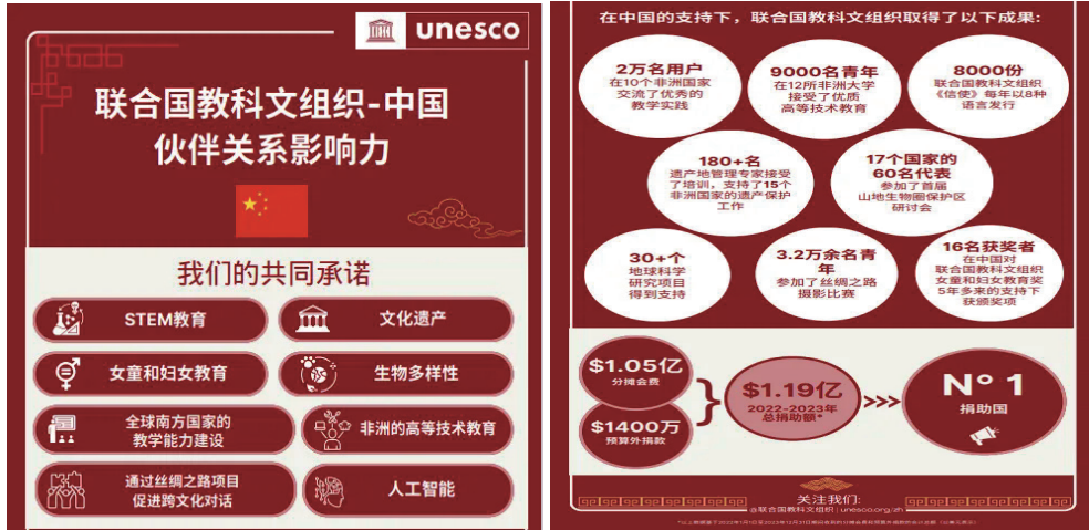
联合国教科文组织—中国伙伴关系影响力

2014年以来，中国与联合国教科文组织合作取得了丰硕成果。双方共同推动文明交流互鉴、合作实施联合国教科文组织优先战略，取得了一系列重要合作成果，特别是在促进发展中国家教育、科学和文化发展方面，为和平与可持续发展作出了贡献。