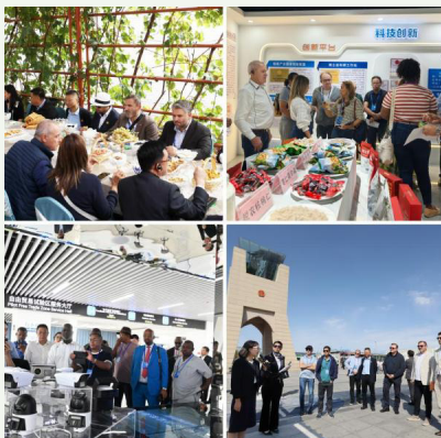
与会外国议员在新疆多地参访

2025年9月14日，国际议员友好交流论坛在乌鲁木齐成功举行。来自五大洲的60余位外国议员和前议员以及60余位中国全国人大及地方人大代表出席论坛。与会各国议员表示，当今世界面临诸多全球性挑战，为实现人类和平与发展的共同目标，国际团结合作尤为重要。论坛总结各方观点并发布了《乌鲁木齐宣言》。国际议员友好交流论坛前两届论坛分别于2023年和2024年在深圳市和上海市举办。本届论坛是迄今参与国家最多、来华议员规模最大的一届。