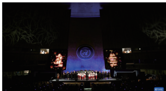
2025年6月9日，纽约联合国总部，演员在“跨越山海的文明对话” 专场文艺演出上表演合唱。