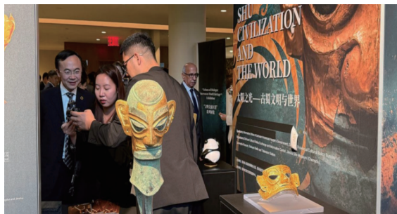
嘉宾参观文明交流互鉴长卷展览 (图片来源：联合国网站)

流互鉴感悟，中国传统名曲奏响在艺术之都。在内罗毕，中国和肯尼亚文化团队联袂演出。在曼谷，中国同泰国等8个国家一道举办文明图片展、组织文明体验活动。在巴黎，中国同联合国教科文组织共同举办“丝路青年对话未来”研讨会。此外，在越南、马来西亚、新加坡、巴林、摩洛哥、尼日利亚、塞尔维亚、丹麦、罗马尼亚、智利、玻利维亚、澳大利亚等80多个国家，中国同各方围绕“文明对话国际日”开展主题研讨会、青年交流会、专家对话会和丰富多彩的文明交流体验活动，进一步推动全球文明对话更加深入。