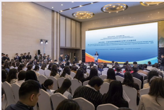
2025中国—中亚国家治国理政研讨会暨人文交流对话活动现场。

2025年5月，2025中国—中亚国家治国理政研讨会暨人文交流对话在哈萨克斯坦阿斯塔纳举行。本次活动由主论坛、成果发布、四个分论坛组成，主题为“现代化与区域合作：走向共同繁荣之路”。中国、哈萨克斯坦、吉尔吉斯斯坦、塔吉克斯坦、土库曼斯坦、乌兹别克斯坦6国约260位嘉宾出席，围绕各国现代化建设实践、区域合作路径、文明互鉴举措等展开深入研讨，凝聚广泛共识。