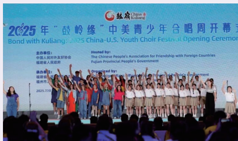
2025年“鼓岭缘”中美青少年合唱周开幕式

2025年“鼓岭缘”中美青少年合唱周活动于7月9日至18日在福州、北京成功举办。活动以“歌唱和平”为主题，两国约30支合唱团，1000多名青少年参加，是“5年5万”倡议实施以来规模最大的主题性中美青少年交流活动。通过传递“以史为鉴、珍视和平”的价值观，合唱周展现了两国青少年对和平的共同追求与担当。习近平主席夫人彭丽媛出席北京段中美青少年联谊活动并致辞，勉励同学们传承中美友谊，促进和平友好，为两国美好未来贡献青春力量。