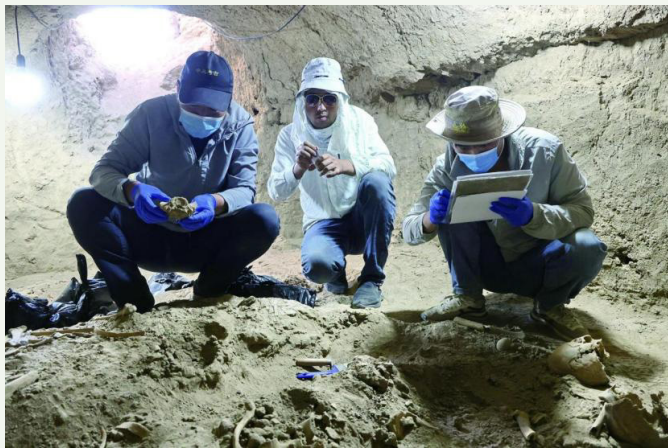
中乌联合考古队员在清理墓葬

2011年，中国与乌兹别克斯坦签署考古合作协议。自2012年起，双方考古人员共同在费尔干纳盆地开展田野发掘，至今已十余载。考古工作的首站是位于盆地南部的明铁佩古城遗址。经过多年发掘，团队在此厘清了城市格局、生活遗迹与文化层叠。2023年之后，联合考古队将视线转向年代稍晚的蒙扎铁佩遗址。蒙扎铁佩，乌兹别克语意为“串珠台地”。2024年，此地出土1300余枚串珠，种类繁多、工艺精湛，反映出当时领先的手工业水平与跨地域的贸易交流。