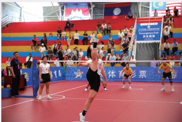
2025年6月1日，2025中国—东盟藤球比赛现场。

藤球兴于东南亚地区，比赛中参赛选手可以用脚腕、膝关节等夹球、顶球的方式击球过网，因与排球运动类似，又有“脚上的排球”之称。藤球技巧性高，观赏性和竞技性强，尤其是运动员在比赛中用到的倒挂金钩式扣球、半空齐肩踢球等高难度动作，极具观赏性。